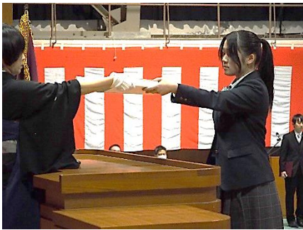
卒業証書授与（普通科）