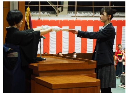
卒業証書授与（農業環境科）