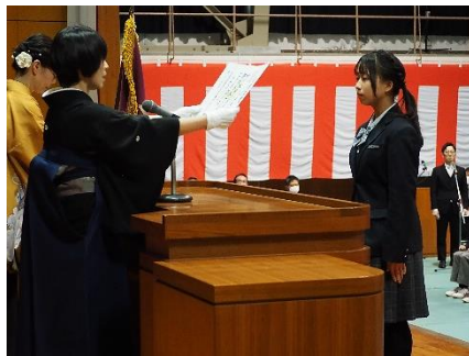
卒業証書授与（国際科）