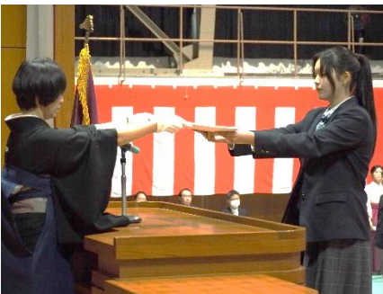
卒業証書授与（福祉科）